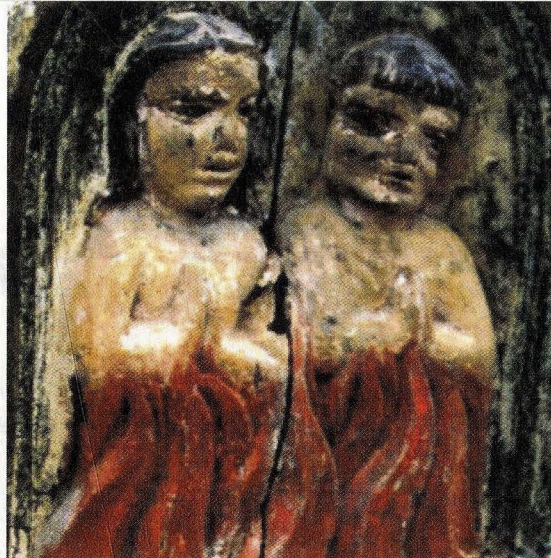
[1670] Peto de ánimas do Santuario de Nosa Señora do Mundil (Cartelle)

Os testamentos tamén constitúen un instrumento esencial para a comprensión da organización e