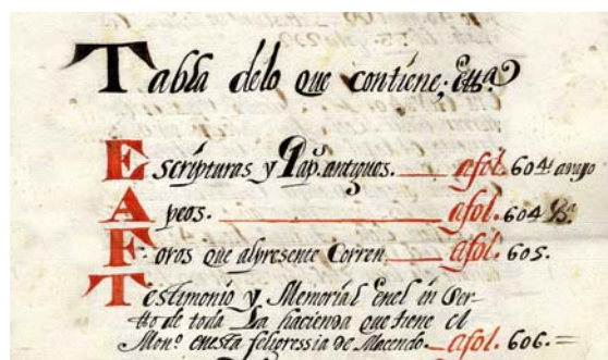
Tabla de contenido o índice de los documentos insertos en el Tumbo dorado del Monasterio de Melón (siglo XVIII) referidos a los bienes y derechos del monasterio en Santa María de Macendo.

Estos archiveros solían anotar en los tumbos recomendaciones para el buen gobierno del archivo, lo que hace posible un acercamiento a las prácticas archivísticas y de gestión de aquel tiempo. Asimismo, los tumbos también permiten aproximarse a la organización y contenido del propio archivo en