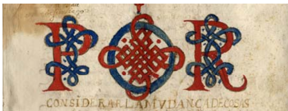
Detalle do tomo da Casa Sta. Cruz de Arrabaldo.