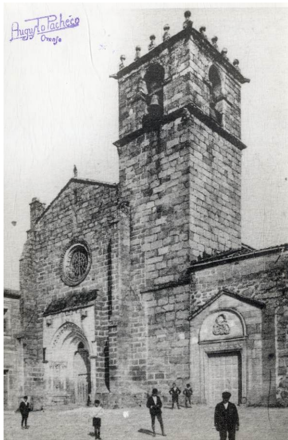
Fachadas da igrexa gótica de San Francisco e da capela da Orde Terceira na súa localización orixinal nas faldras de Montealegre.

A Constitución redactada nos inicios da Restauración borbónica e promulgada en 1876 declarou ao Catolicismo relixión oficial do Reino. Este cambio de actitude do Estado cara á Igrexa favoreceu a recuperación de boa parte das posicións perdidas por esta nas décadas de 1830-1840 e durante o Sexenio democrático (1868-1874). Neste contexto de " renacemento católico " produciuse a restauración das ordes relixiosas tradicionais, coma os franciscanos, e mesmo o establecemento doutras sen implantación anterior.