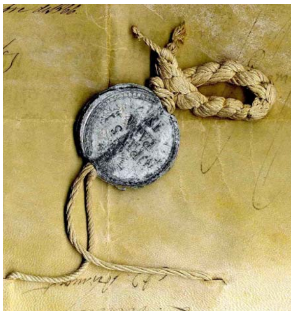
Selo pendente de chumbo con fíos de seda nunha bula do papa Pío IX do ano 1866. AHPOu, Concello de Ourense, Cp. 22/29,

Un selo é o sinal sobre calquera materia plástica dunha matriz gravada sobre materias duras, como metal ou pedra, e formada na súa aparencia externa por distintas figuras como imaxes, letras ou debuxos. Na Coroa de Castela utilizáronse como elementos de validación desde 1120. Primeiro foron empregados por reis e bispos, logo por outras autoridades eclesiásticas, nobres e polos concellos; por último, estendéronse a outros particulares.